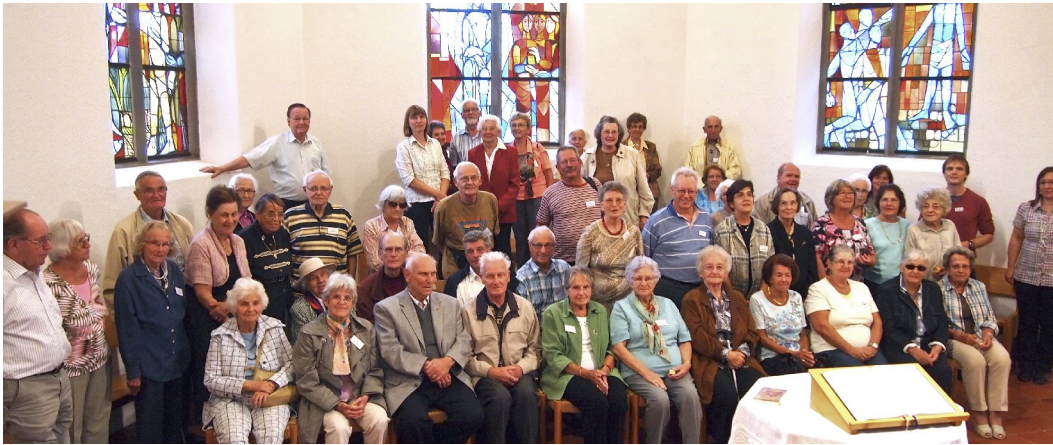
Im Schwarzbubenland besuchten die 51 Personen das Musikautomatenmuseum in Seewen/SO.