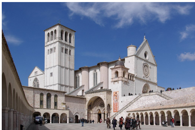
Die Basilika San Francesco ist die Grablegungskirche des Franz von Assisi.

Diese Reise zeigt einmal mehr, dass sich der christliche Glaube nicht an eine Konfession hält, sondern es können zusammen Grenzen überschritten und viele vergnügliche Stunden erlebt werden.