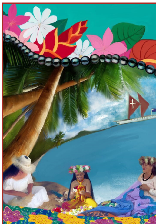
Bild: Titelbild WGT 2025