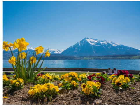
Bilder: Umgebung Thunersee

Wir freuen uns auf rege Teilnahme an unserer Ferienwoche. Gönnen Sie sich diese wohltuenden Tage im schönen Berner Oberland.