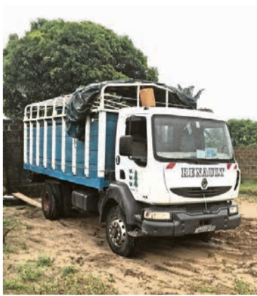
Einer der beiden Lastwagen wartet auf seinen Einsatz.

Nun hat diese Regierung von einem Tag auf den andern beschlossen, auch Hilfswerke auf ihren «Handel» zu besteuern – mit einer horrenden Rate von 25% auf den