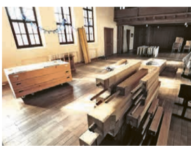
Die Sanierungen sind in vollem Gange.