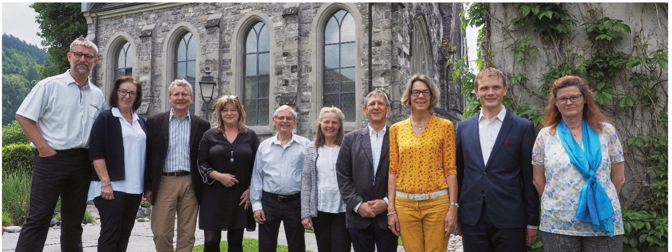
Kirchgemeinderat mit Pfarrer, Sekretärin und Sozialdiakon