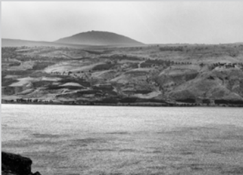
Berg Tabor vor dem See Genezaret