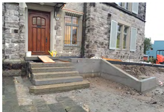
Die 15 Meter lange Rampe überwindet einen Höhenunterschied von ca. einem Meter.