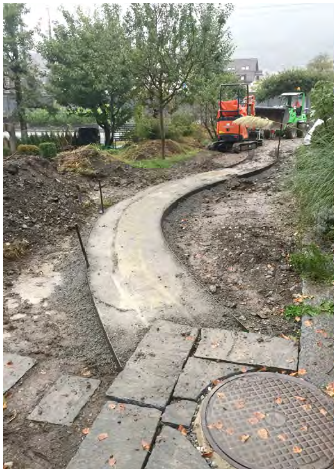
Der geschwungene Gartenweg wird erstellt

Nachdem das Pfarrhaus im Mai bezugsbereit war und wir im Juni das 125-Jahrjubiläum feiern konnten, blieb noch die Fertigstellung der Aussenanlagen. Die Baukommission entschied sich, den defekten Treppenlift durch eine behindertengerechte Rampe zu ersetzen. Hierfür brauchte es eine Baueingabe und Rücksprache mit dem Denkmalpfleger, deshalb konnten die Arbeiten erst Ende August begonnen werden. Inzwischen ist die Rampe erstellt und der Garten für die Aussaat des Rasens vorbereitet. Der Vorplatz wird wieder mit Steinplatten gestaltet und um eine neue Bank ergänzt. Jetzt können nicht nur Rollstuhlfahrer, sondern auch Gebehinderte oder Eltern mit Kinderwagen problemlos ins Pfarramt und von dort in die Kirche gelangen.