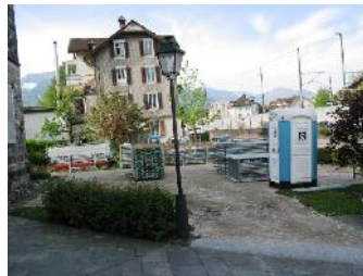
Die Baustelle ist eingerichtet