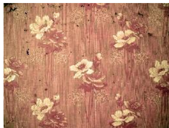
Tapete 20-iger Jahre

Dann begannen die Handwerker den Strom, Wasser und Heizungen abzuhängen. Manche historische Tapeten kamen zum Vorschein, als die Holz-Verkleidungen von den Wänden kamen.