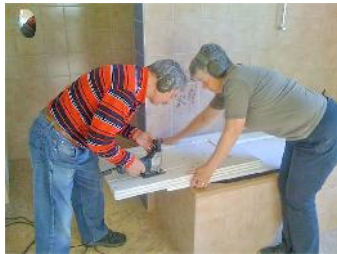
Aus alten Schränken werden Souvenirs

In den Tagen nach Ostern wurde der Bauplatz eingerichtet, das Pfarrhaus eingestrichen und die Orgel gegen Staub verpackt.