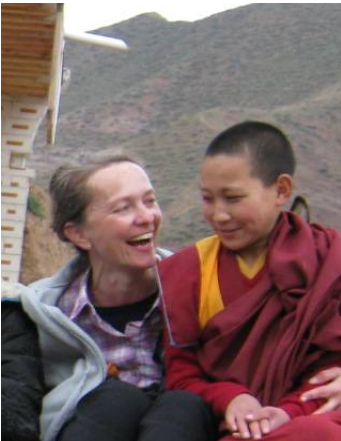
Wiedersehen mit Patenkind

Achong Namdzong Nunnery Health Care Project